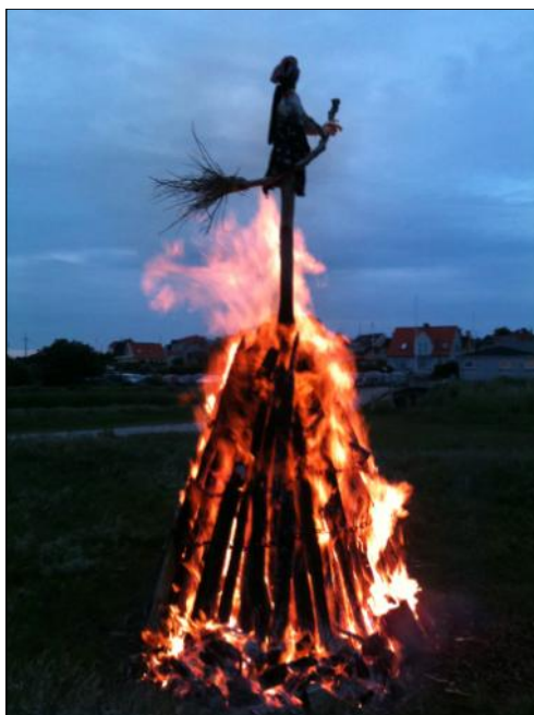
Foto fra sidste års St. Hansfest.

Traditionen tro afholder forsamlingshuset igen i år Sankt Hans Fest med spisning af helstegt svin. Hold øje med opslag på pælene angående pris og tilmelding.